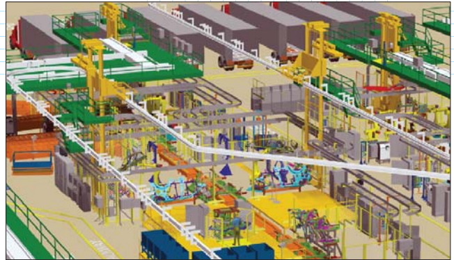
Рис. 1. В качестве решения для цифрового производства UGS предлагает систему Tecnomatix

В качестве конкретного DM -решения компания UGS предлагает систему Tecnomatix (о приобретении компанией UGS израильского разработчика Tecnomatix Technologies Ltd. см. Observer #5/2004).