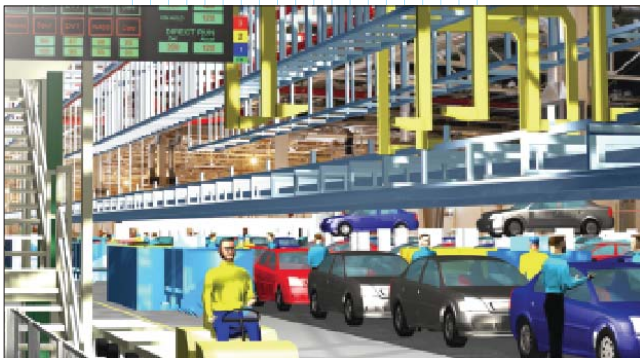
Рис. 2. Средствами Tecnomatix можно проектировать производственное оборудование и оптимально размещать его в цеха

В отличие от других DM -систем, Tecnomatix предоставляет набор интероперабельных программных приложений, которые аккумулируют опыт промышленного производства и поддерживают все этапы производственного цикла (план, проект, утверждение, реализация). Эти гибкие открытые приложения могут использоваться как независимые программы или быть интегрированы с системой