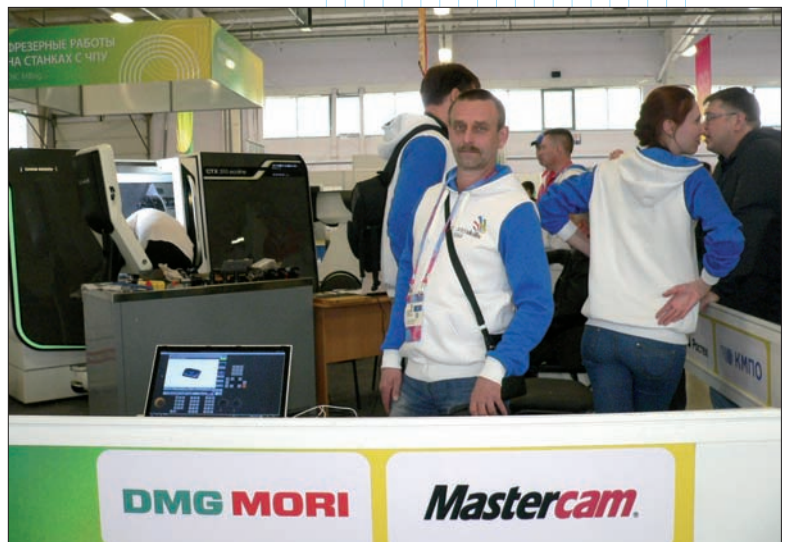
Порой (как и в обычной жизни) число экспертов на стенде многократно превышало число соревнующихся