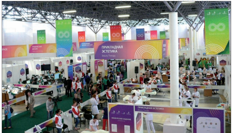
Для проведения соревнований по каждой специальности участникам отведена своя зона

Комментарии здесь излишни. Поэтому в этом году, накануне чемпионата мира WorldSkills в Сан-Паулу (Бразилия), по инициативе компании DMG MORI и агентства WorldSkills Russia ,