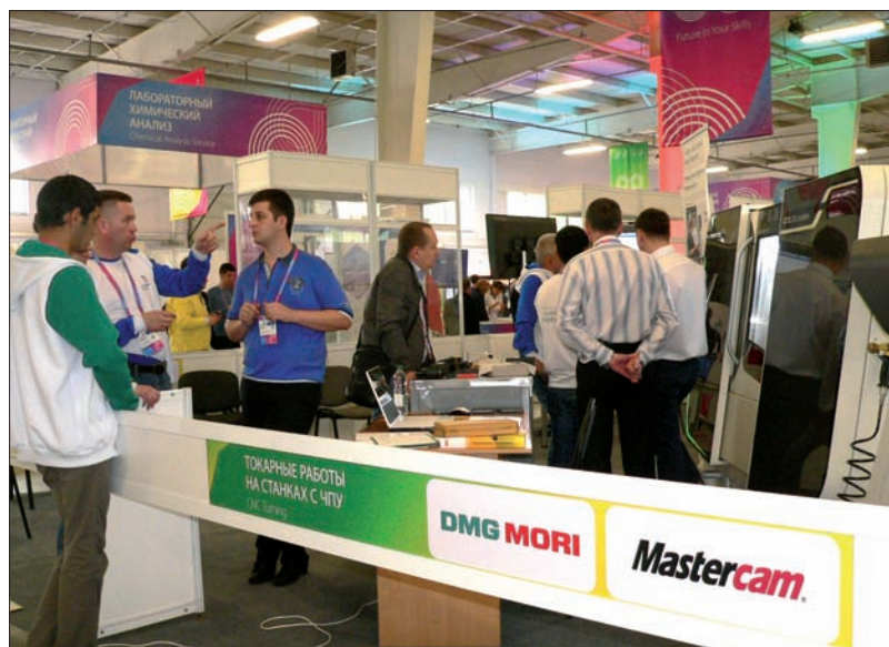
Строгие инструкции и наставления экспертов

Действительно, уже два десятилетия CAD/CAM -система Mastercam является наиболее популярным и распространенным в мире решением для автоматизации процесса создания управляющих программ для станков с ЧПУ. Эта система используется для программирования обработки деталей различных классов на токарных, фрезерных, электроэрозионных, токарно-фрезерных станках и обрабатывающих центрах, на автоматах продольного точения ( Swiss Type ), а также для обработки с помощью промышленных роботов. По информации аналитической компании CIMdata , техническое обслуживание пользователей Mastercam осуществляют 427 компаний-дилеров по всему миру.