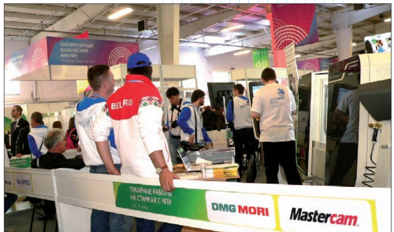
Критический момент соревнований. Времени остаётся всё меньше

Свыше 500 участников и свыше 600 экспертов со всех регионов России встретились в Казани, чтобы побороться за звание лучшего профессионала