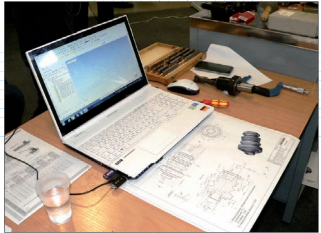
Токари должны были запрограммировать в Mastercam X8 обработку детали, представленной на чертеже, и изготовить её на станке CTX 310 Ecoline

Группа компаний ЦОЛЛА является авторизованным дистрибьютором Mastercam в России и СНГ на протяжении 25-ти лет. Благодаря наработанному за это время богатому опыту и компетенции, команда специалистов ЦОЛЛА стала поставщиком и внедренцем системы Mastercam на многих известных промышленных предприятиях России. В их числе: СПб ОАО «Красный Октябрь», ММЗ «Знамя», МОКБ «Марс», НПП «Полёт» (Нижний Новгород), НПП «Алмаз» (Саратов), ПО «Старт» (Заречный), НПП «Исток» (Фрязино), МЗ «Арсенал» (С.-Петербург), «Приборостроительный завод» (Трехгорный), «Авиадвигатель» (Пермь), «Красмаш» (Красноярск), «Комета» (Вышний Волочёк), МЗ «Электросталь», НПО «Гидромаш» (Москва) и свыше сотни других предприятий всех отраслей промышленности. Таким образом, ГК ЦОЛЛА обладает уникальными знаниями и базой разработанных постпроцессоров любой сложности, что позволяет запускать процесс обработки на станках с ЧПУ в самые сжатые сроки. Команда ЦОЛЛА специализируется на проведении начальных, базовых и продвинутых курсов обучения работе с системой Mastercam , включая поверхностную и многокоординатную обработку, а также развивает программу сотрудничества с вузами, колледжами и техническими школами.