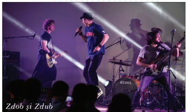
Zdob și Zdob

Самым ожидаемым моментом вечерней программы всегда считается розыгрыш призов. Призов было много, а значит, столь же много оказалось их счастливых обладателей, любимцев капризной фортуны. Отдельно поздравляем “десятку” новых обладателей бесплатной подписки на Observer на 2015–2016 гг. После обильного ужина, многочисленных тостов и конкурсов, разогретую публику удалось расшевелить при помощи зажигательных ритмов друзей из Молдавии – группы Zdob și Zdob : “Видели ночь, гуляли всю ночь до утра”...☺