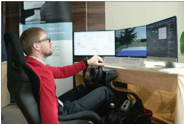
Авто- и авиасимулятор с программным обеспечением LMS