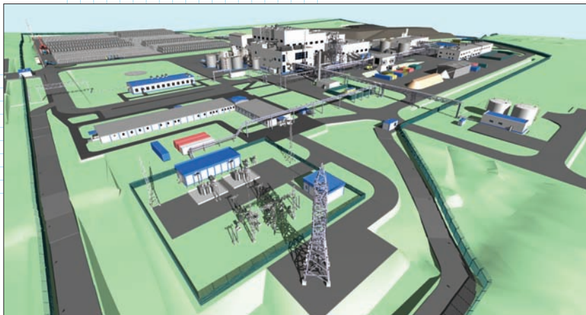
Название проекта: Амурский гидрометаллургический комбинат Мощность проектируемого объекта: 225 000 тонн концентрата Автор проекта – ЗАО “Полиметалл Инжиниринг”

изменениями функция поддержки и хранения нескольких версий крайне важна, поскольку она обеспечивает логичный процесс создания, мониторинга и одобрения изменений,