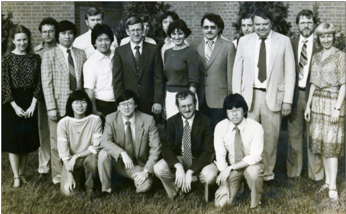
Команда сотрудников AspenTech (1981–1982 г.)

Наша продолжительная история достижений стала возможной во многом благодаря способности компании оперативно помогать заказчикам решать новые задачи. Мы разработали инновационные решения, которые обеспечивают значительные преимущества для наших заказчиков как с технической, так и с финансовой точки зрения, оптимизирующие проектирование, эксплуатацию и техническое обслуживание предприятий по всему миру.