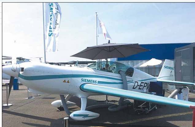
Электролёт-рекордсмен Extra 330LE на Парижском авиасалоне 2017 года

Рекорды ставит не только сам самолет Extra 330LE . Электрическая