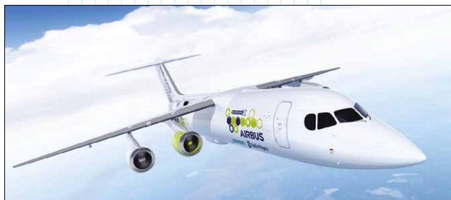
Самолет E-Fan X (рендеринг)

Все, кто связан с авиацией, знают, что самолеты должны стать более эффективными и менее шумными, а также сократить свою зависимость от ископаемых видов топлива. Но как добиться этого, если конструкция самолета, честно говоря, не сильно изменилась с конца 1950-х, когда появился Boeing 707 ? Очевидно, тут требуется действительно революционная инновация. И она появляется прямо сейчас.